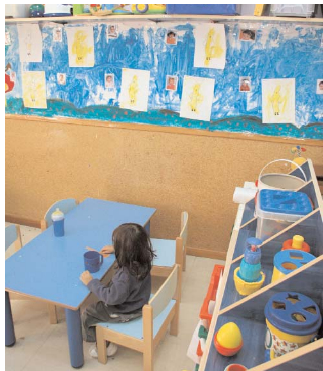
La educación de los niños de 0-3 requiere la presencia de profesionales debidamente cualificados.

La diversidad de situaciones en las que se encuentran los profesionales resulta escandalosa, tanto por las titulaciones exigidas como por las condiciones laborales y los sueldos que se pagan por trabajos semejantes, dependiendo si trabajan en un centro público, privado o centro no autorizado.