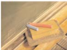
Homenaje al Maestro